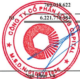
Tổng Giám đốc Hà Nội, ngày 19 tháng 10 năm 2021